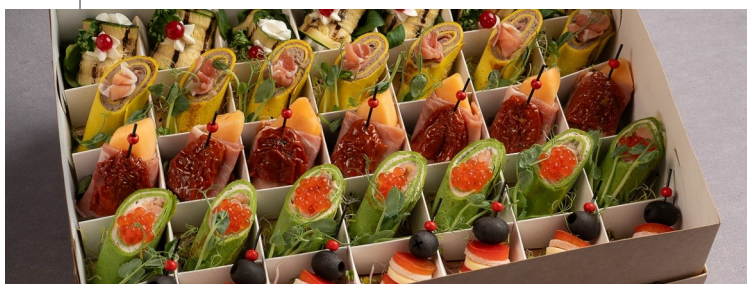
Partyboxy / fingerfoody